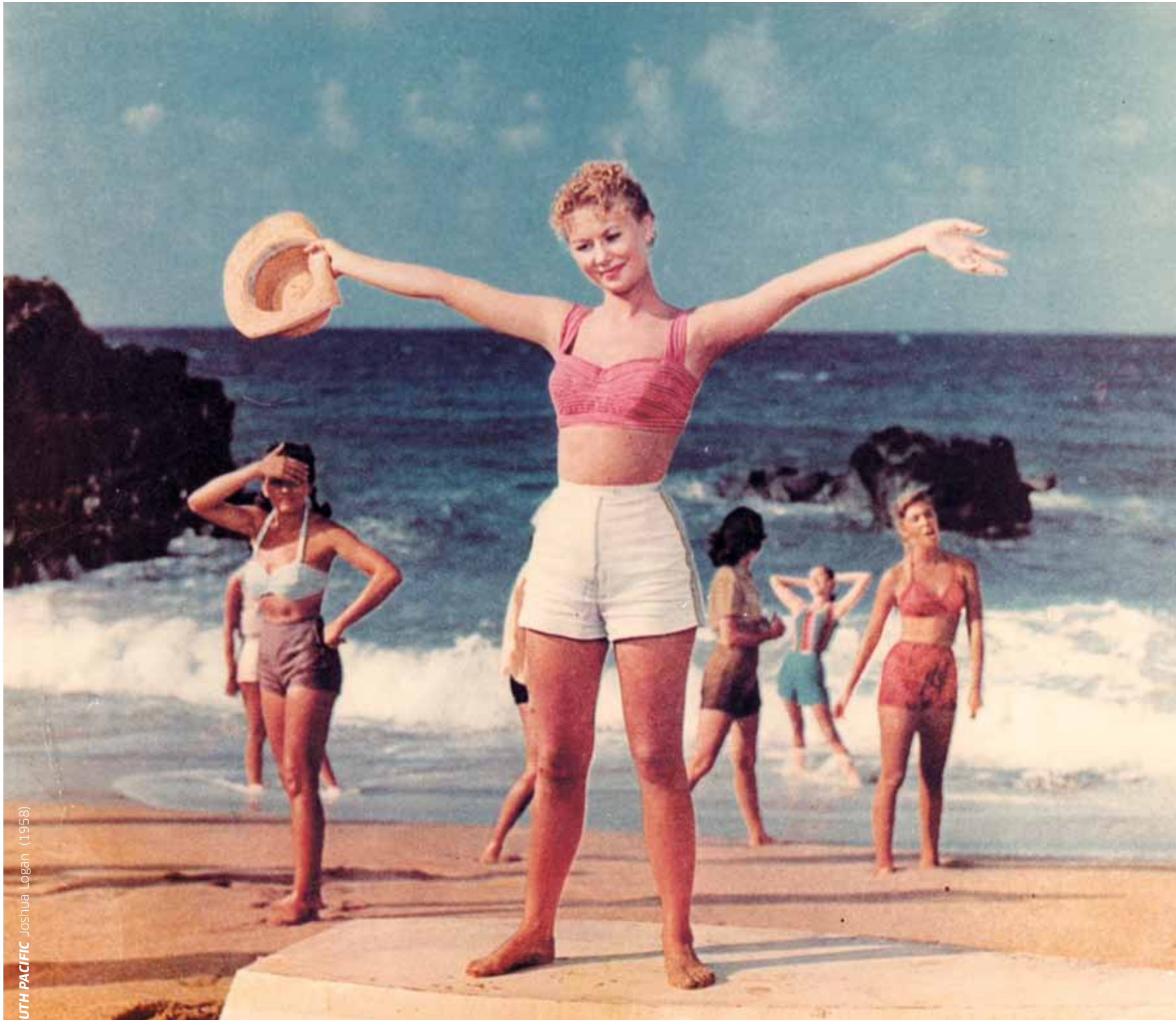
UTH PACIFIC Joshua Logan (1958)